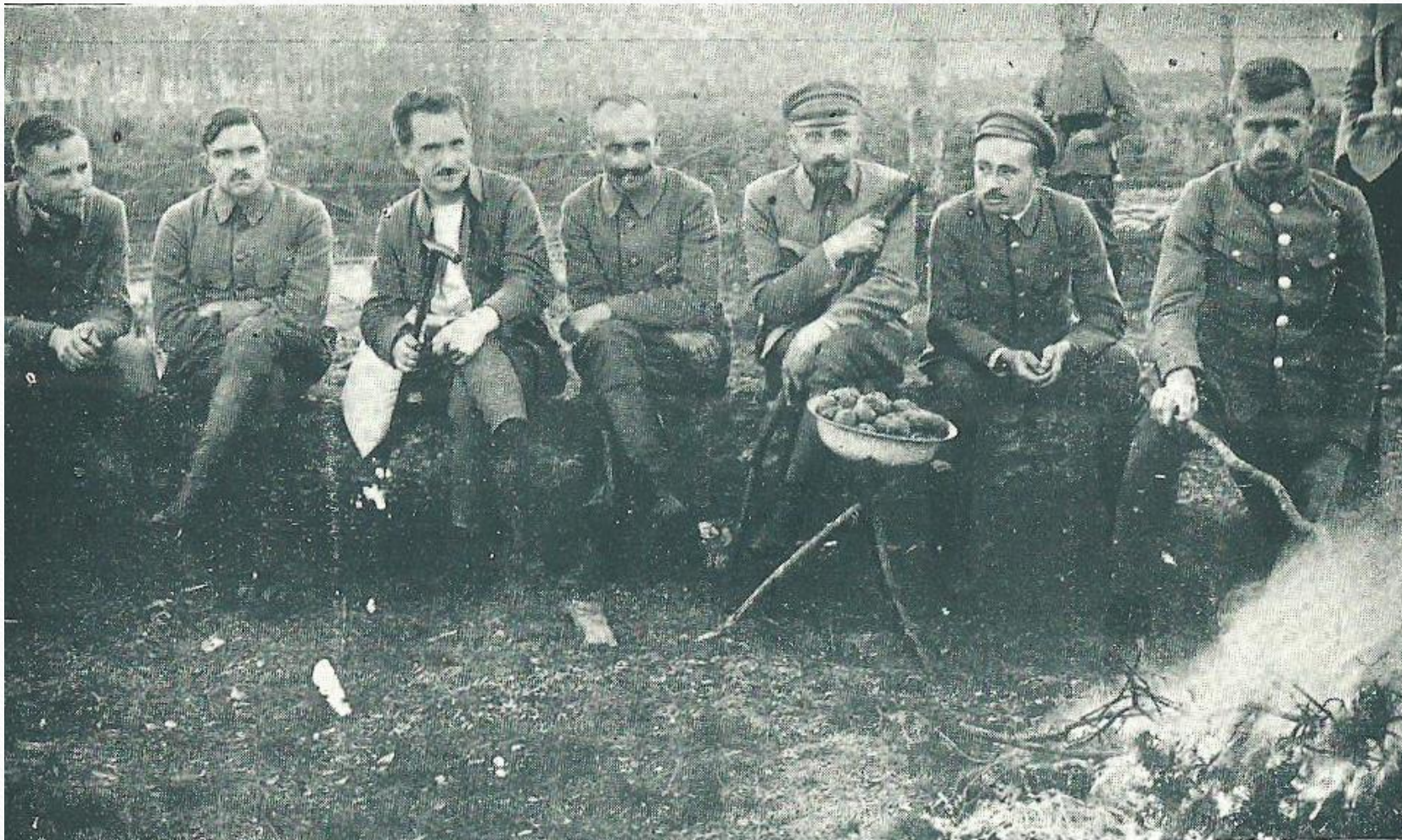
Oficerowie legionowi internowani w Beniaminowie