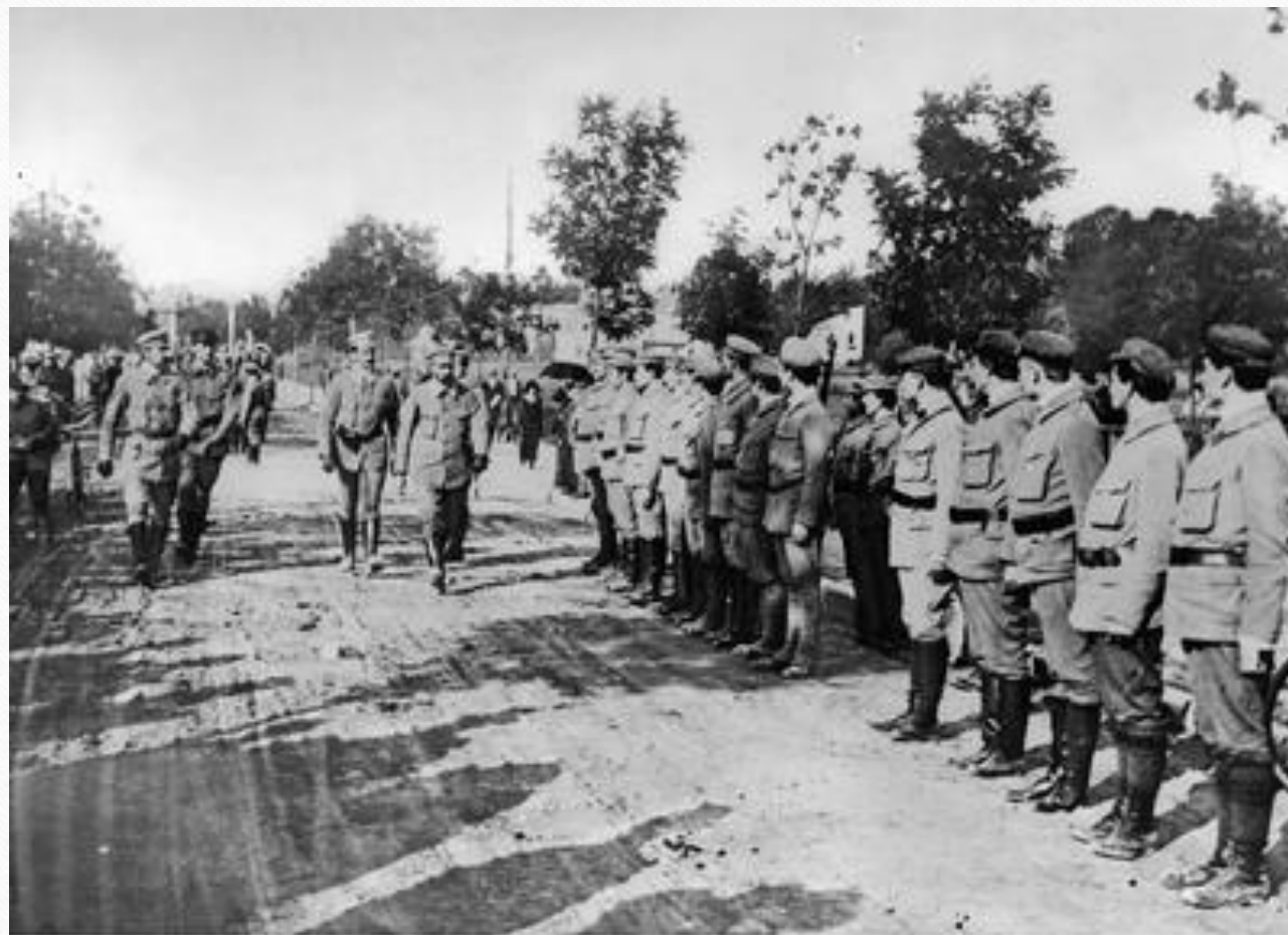
Ćwiczenia Związku Strzeleckiego w Zakopanem 1913