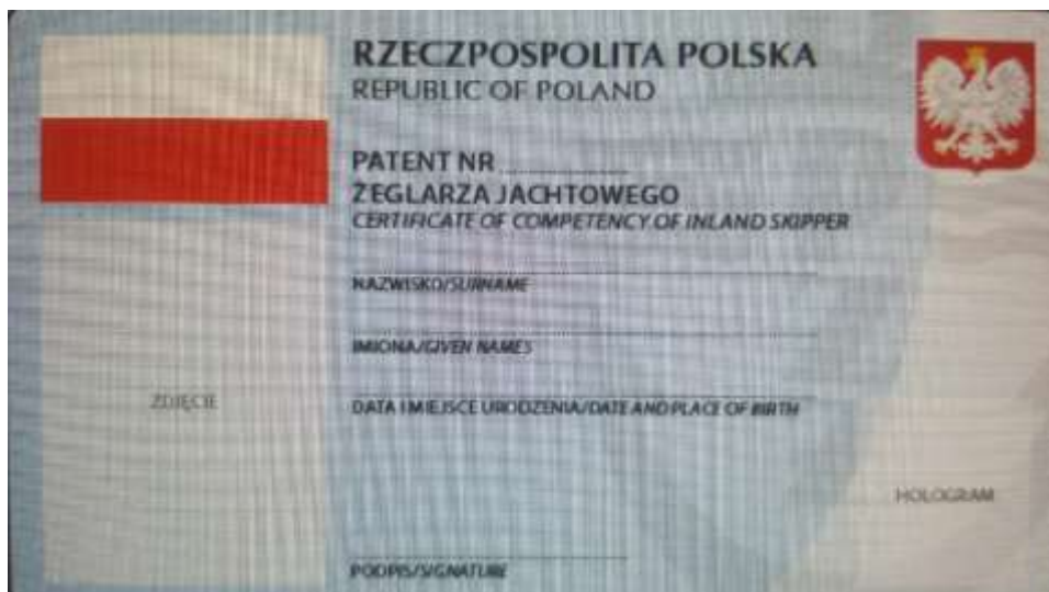
Na zdjęciu widoczny wzór patentu żeglarskiego (żeglarz jachtowy)

Rozporządzenie Ministra Sportu i Turystyki z dnia 9 kwietnia 2013 r. w sprawie uprawiania turystyki wodnej.